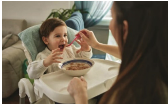
شکل ۷. نحوه غذا دادن به کودک در حالی که والد روی کودک قرار گرفته است.