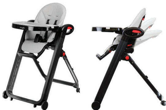
شکل ۱. صندلی غذاخوری کودک

در فرایند این مقاله به بیان مسئله و موضوعات و مشکلات موجود در رابطه با کودک و محصول صندلی غذاخوری کودک و تعاملات ایشان با والد پرداخته شده و در رابطه با این مسئله سؤالات و اهداف پژوهش مشخص شد.