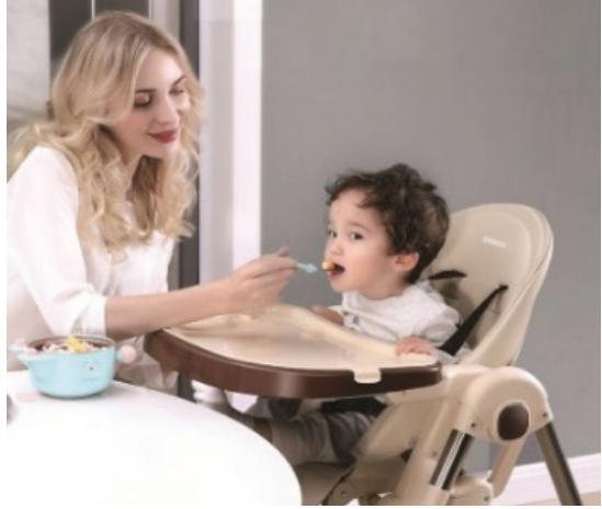
شکل ۶. نحوه غذا دادن به کودک در حالی که والد در کنار صندلی قرار گرفته.