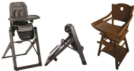
شکل ۴. (سمت راست) صندلی با قابلیت تنظیم ارتفاع، پستی و چرخدار. شکل ۵. (سمت چپ): صندلی‌های سنتی بدون قابلیت تنظیم ارتفاع زاویه تکیه‌گاه، عملکرد صلب زاویه تکیه‌گاه و عملکرد منعطف

نشده و باعث افتادن کودک نشوند؛ بنابراین باید به پایداری صندلی یعنی سطحی که در تماس با زمین است توجه بیشتری داشت. دیگر آنکه صندلی‌های قدیمی که ساخت اولین نمونه از آن‌ها به سال ۱۶۶۰ در قرن هفدهم بر می‌گردد و توسط کارگاه‌ها برای افراد خاص که اکثراً ثروتمندان بودند ساخته می‌شد؛ امکان تا شدن و تنظیم ارتفاع ندارند ولی مدل‌های جدید این امکان را دارند؛ به همین دلیل استفاده از آن هم در خانه و هم زمانی که نیاز به جابه‌جایی هست، کارایی دارد (شکل ۴). همچنین بهتر است صندلی غذای کودک دارای چرخ‌هایی باشد که بتوان به راحتی آن را جابه‌جا کرد و همین‌طور برای ثابت نگه‌داشته شدن آن، امکان قفل شدن چرخ را هم داشته باشند تا ایمنی کودک حفظ شود.