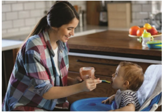
شکل ۸. نحوه غذا دادن به کودک در حالی که والد طرف غذا را در دست گرفته.