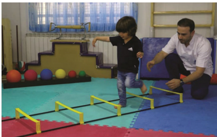
شکل ۲. مهارت‌های حرکتی درشت: بلند کردن پا از روی موانع بدون برخورد با موانع (www.iranrehab.ir)

این نوع مهارت‌ها مرتبط با توانایی در به حرکت درآوردن بخش‌های مختلف بدن و حفظ تعادل میان آن‌ها است. حرکت راه رفتن، پرتاب کردن، گرفتن و بلند کردن وسایل، که در گروه فعالیت‌های حرکتی