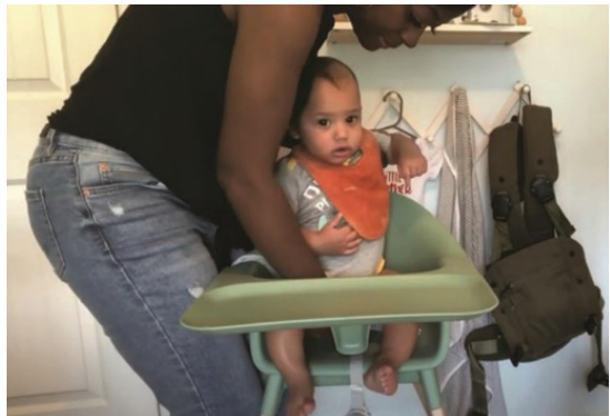
شکل ۹. قراردادن و برداشتن کودک از داخل صندلی. (youtube.com/watchi66mpUNfl2M)